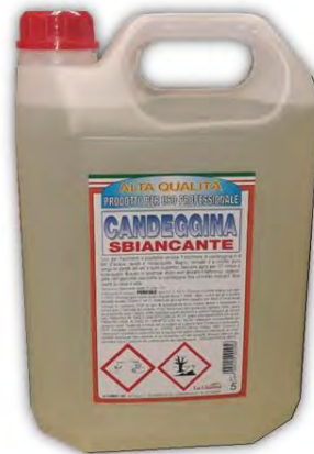
CANDEGGINA (ipoclorito di sodio) 0,5%

SE VUOI UTILIZZARE PRODOTTI DIVERSI DEVI FARTI ATTESTARE PER ISCRITTO DAL PRODUTTORE / FORNITORE CHE HANNO CARATTERE VIRUCIDA NEI CONFRONTI DEL CORONAVIRUS SARS-COV 2