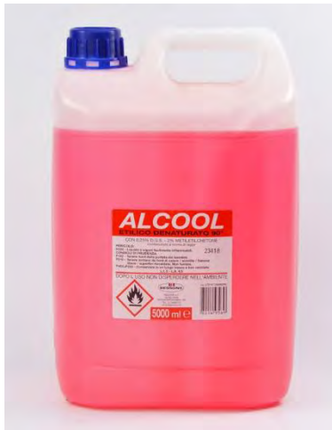
ALCOOL ETILICO 75%

I prodotti da utilizzare per la sanificazione (dopo le normali pulizie) sono: